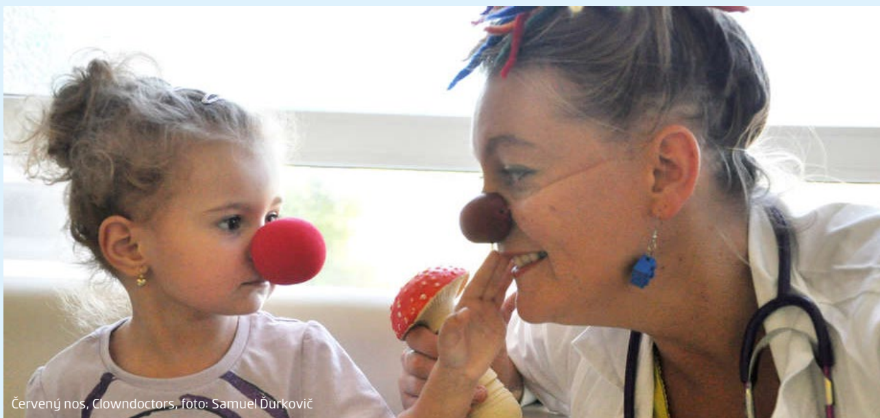
Červený nos, Clowndoctors

Doktor Špenát, sestrička Epidémia Váhavá či asistent Biška pomáhajú deťom nadobudnúť pocit dôležitosti a hodnoty samého seba. Cieľom projektu bolo priniesť nezvyčajnú formu zábavy a humoru detským pacientom často dlhodobo odlúčeným od rodiny a ponúknuť im aj tzv. podpornú liečbu. Tá spočíva v úzkej spolupráci s personálom Detskej psychiatrickej liečebne v Hrani.