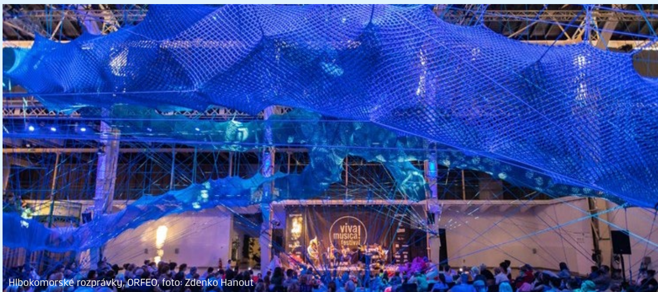
Hlbokomorské rozprávky, ORFEO