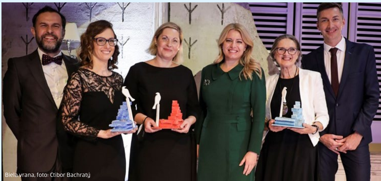
Biela vrana