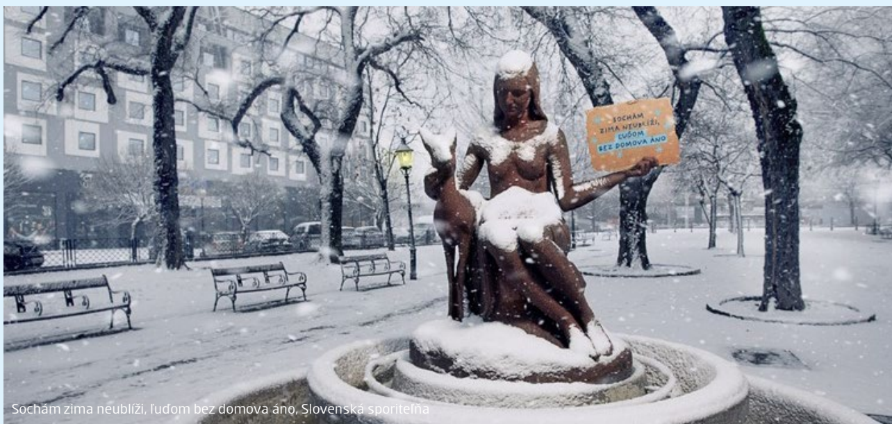
Sochám zima neublíži, ľuďom bez domova áno. Slovenská sporiteľňa

Do internej zbierky Štedrá večera sa zapojilo 404 zamestnancov Slovenskej sporiteľne a 7 základných odborových organizácií. Počas 11 dní sa podarilo vyzbierať sumu 8 730 eur, z ktorej nadácia väčšinu použila na zakúpenie 50-eurových poukážok na nákup potravín v obchodnom reťazci pre 150 jednorodičovských rodín . Poukážky boli rodinám, prihláseným do programu Hodina deťom (Nadácia pre deti Slovenska) , distribuované pred vianočnými sviatkami. Zvyšná suma bude venovaná Nadácii pre deti Slovenska na podporu rodín s jedným rodičom na jar 2022.