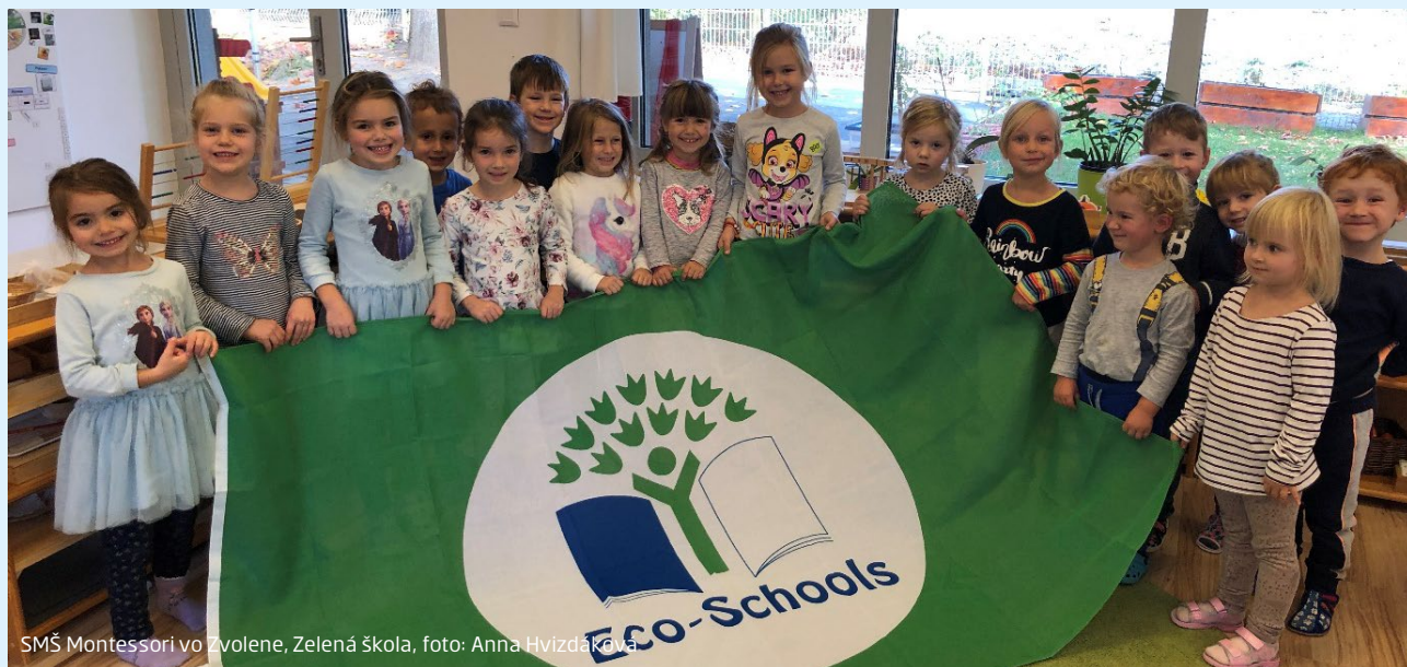
SMŠ Montessori vo Zvolene, Zelená škola