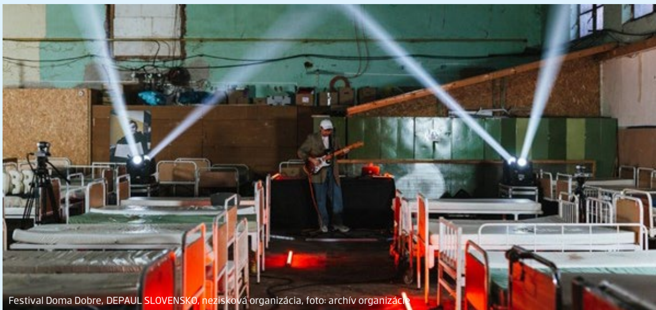
Festival Doma Dobre, DEPAUL SLOVENSKO, nezisková organizácia, foto: archív organizácie

V roku 2021 sa Nadácia Slovenskej sporiteľne rozhodla reagovať na zložitú situáciu jednej z najohrozenejších skupín obyvateľstva – ľudí bez domova, ktorá sa výrazne zhoršila počas pandémie.