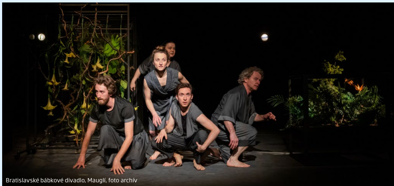
Bratislavské bábkové divadlo, Mauglí