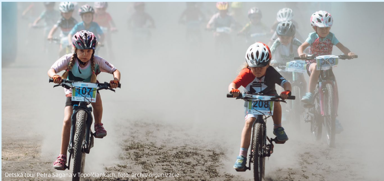
Detská tour Petra Sagana v Topoľčiankach, foto: archív organizácie