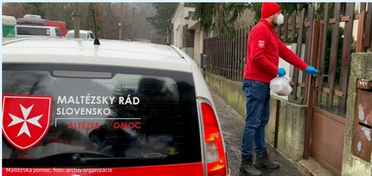
Maltézska pomoc