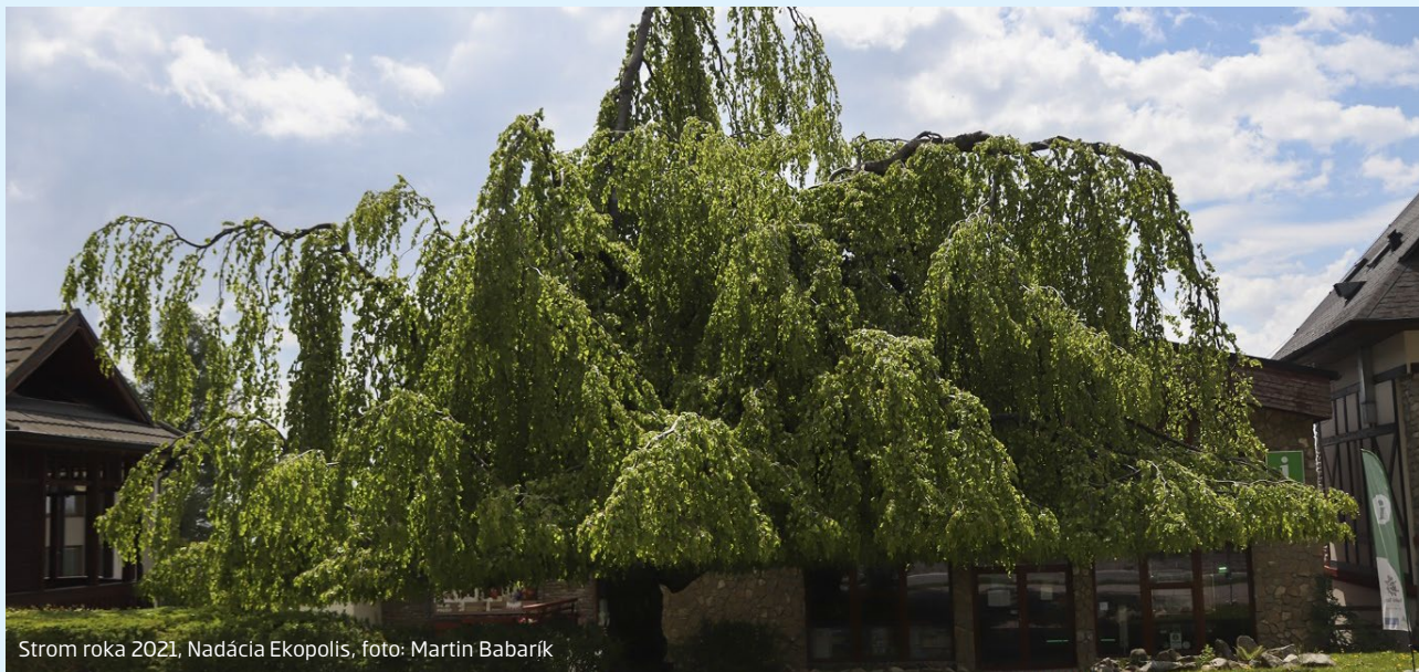
Strom roka 2021, Nadácia Ekopolis