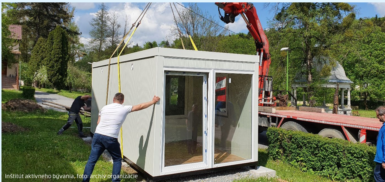
Inštitút aktívneho bývania

V ostatných dvoch rokoch neziskové organizácie potrebovali väčšiu pomoc, ako kedykoľvek predtým. Rovnako ako okolitý svet, aj Nadácia Slovenskej sporiteľne citlivo zareagovala na komplikovanú mimoriadnu situáciu spôsobenú pandemiou a zhoršenými klimatickými podmienkami a svoj najväčší grantový program prispôbila novej situácii.