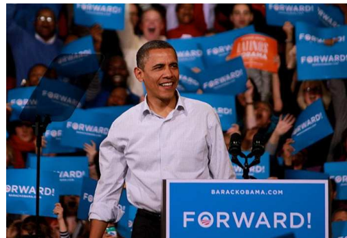
Barack Obama, cu zâmbetul pe buze, imediat după câștigarea alegerilor, Foto: Bloomberg

Votul pentru alegerile prezidențiale din 2012 s-a încheiat, iar câștigător a fost declarat Președintele în funcție, Barack Obama. În ultimele săptămâni, investitorii au urmărit cu atenție campania electorală din Statele Unite. Declarațiile privind politicile economice viitoare au avut de asemenea un impact semnificativ asupra piețelor financiare. Pentru moment, lucrurile vor rămâne neschimbate având în vedere faptul că, din punct de vedere economic, "situația de după alegeri este aceeași cu cea de dinainte de alegeri".