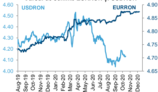
Cursul de schimb EURRON și USDRON