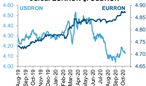
Cursul EURRON și USDRON