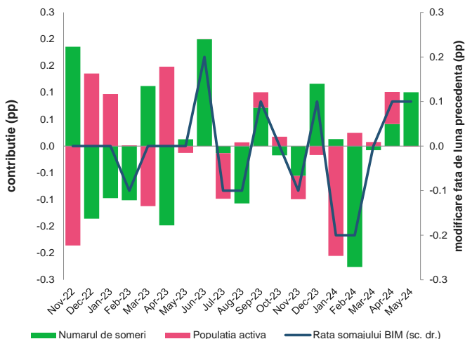
Evoluția ratei șomajului și contribuția factorilor componenți la formarea acesteia