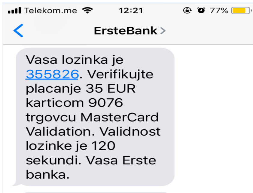
Slika 4 - SMS sa jedнокratnom lozinkom