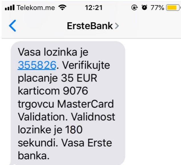
Slika 4 - SMS sa jedнокratnom lozinkom