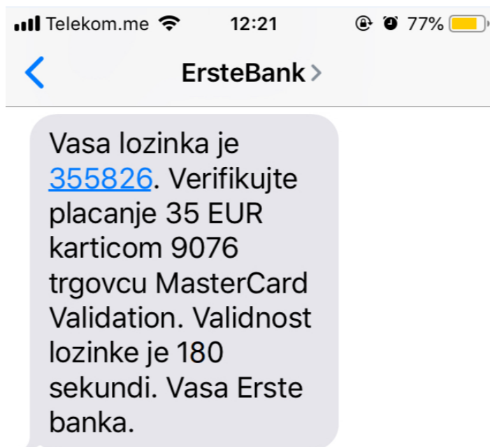
Slika 4 - SMS sa jedнокratnom lozinkom