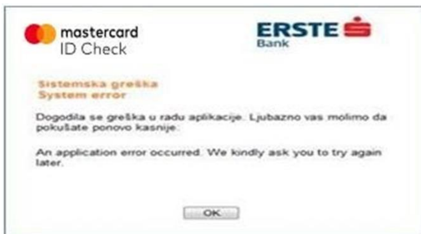
Slika 6 - Poruka o nastaloj sistemskoj grešci

Neispravno funkcionisanje sistema potencijalno predstavlja veći problem i u slučaju sumnje na to neophodno je odmah upozoriti Banku. Korisnicima će u takvim situacijama biti vidljiv ekran na kojem je ispisana poruka o sistemskoj grešci (Slika 6).