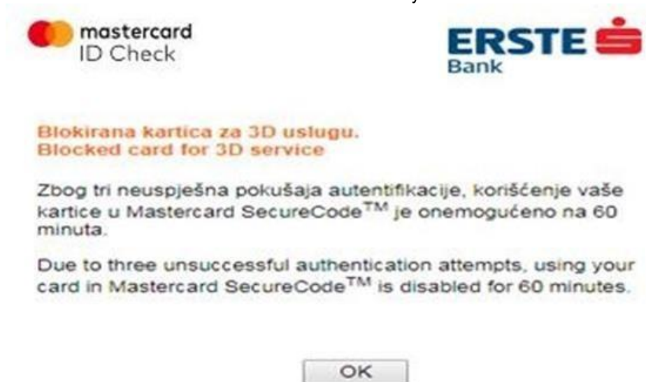
Slika 9 - Poruka o blokiranoj kartici

Ukoliko želite da se kartica deblokira i omoguće se novi pokušaji, pošaljite Zahtjev za deblokadu Mastercard ID Check usluge na mejl kartične službe cards@erstebank.me . Zahtjev je dostupan na internet stranici Banke www.erstebank.me .