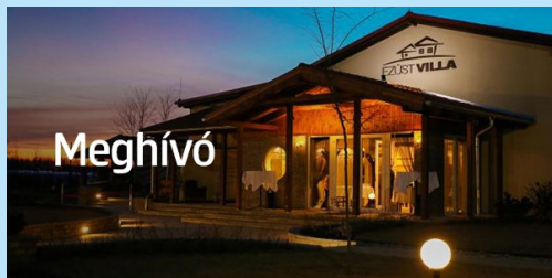
10.10. Agrár szakmai est, Lajosmizse

Októberben folytatódik az Erste Agrár Kompetencia Központ hagyományos rendezvénysorozata. Ezúttal két helyszínen, október 10-én Lajosmizsén, október 17-én pedig a Zselicvölgyben találkozunk agrárügyfeleinkkel, hogy áttekintsük az aktuális kihívásokat. Minden kedves olvasónk tekintse e beharangozót meghívásnak, és regisztráljon a rendezvényekre a következő oldalon található elérhetőségeinken!