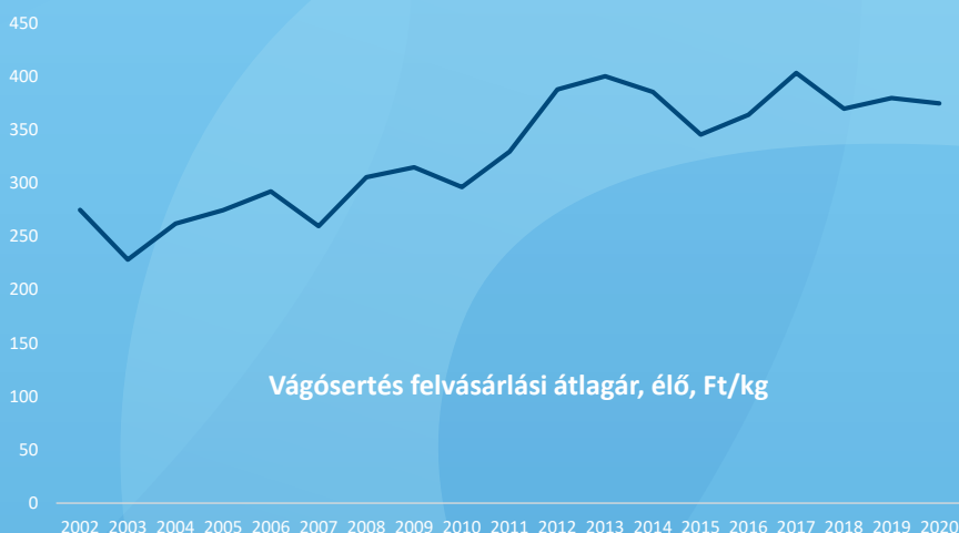
Vágósertés felvásárlási átlagár, élő, Ft/kg

A sertésárakra nem csak a nemzetközi nyomás, hanem a betegség megjelenési is rányomja bélyegét idén. Az elkövetkező években az idén kialakuló ár szintje körüli kisebb ingadozásra számítunk.