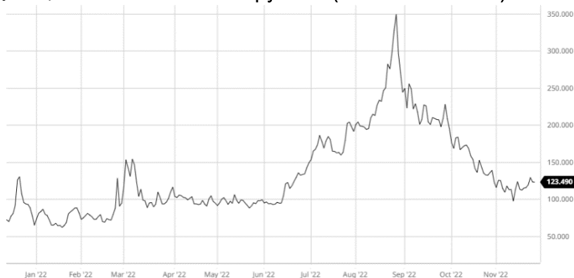
Cena zemního plynu v EU (Dutch TTF Gas Dec '22)

pro zemní plyn. Činí 275 eur a měl by se týkat jen termínových kontraktů na následující měsíc. Podle představ Komise se nicméně spustí jen ve chvíli, kdy plyn v Evropě bude o 58 eur dražší než průměrná cena LNG na světovém trhu. Většina zemí EU s jeho výší však nesouhlasí, jednat by se mělo znovu 13. prosince. Naproti tomu na společných nákupech plynu, vzájemné solidaritě a rychlejším povolování obnovitelných zdrojů energie se ministři zemí EU v zásadě shodli. Zdroje: ldnes.cz , Novinky.cz , barchart.com